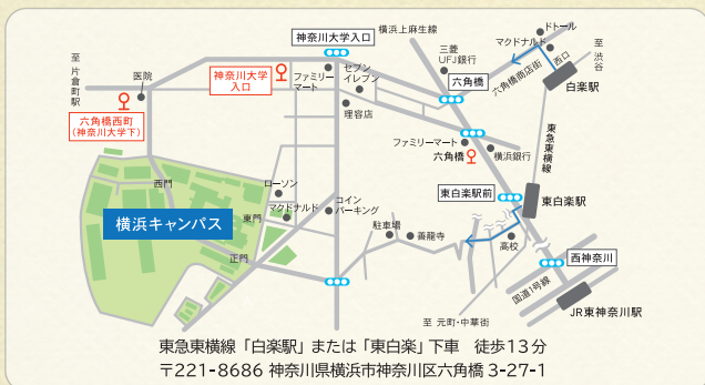
東急東横線「白楽駅」または「東白楽」下車 徒歩13分 〒221-8686 神奈川県横浜市神奈川区六角橋 3-27-1

この度開催されます「フランス週間」を通じて、フランスとわが国との経済・文化など多方面にわたる相互理解が深まることを祈念しております。最後になりますが、「フランス週間」の開催にあたりまして、在日フランス大使館、アンスティチュ・フランセ横浜など多くの関係機関、関係者に多大なご配慮をいただきましたことについて、ここに厚くお礼申し上げます。